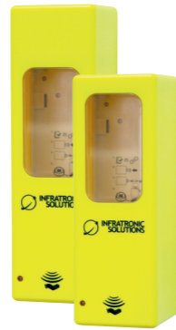
Art.-Nr. 19420 IT 500 AG EURO-2