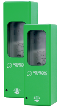
Art.-Nr. 19410 IT 500 AGR EURO-2