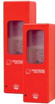
Art.-Nr. 19415 IT 500 AR EURO-2